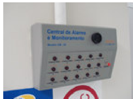
central de comando CM - 02